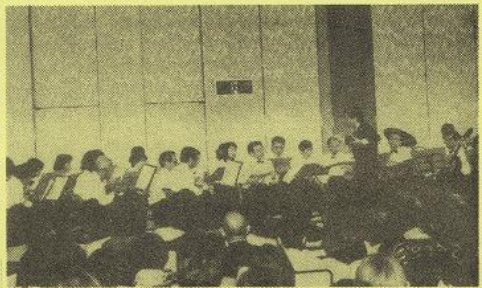
市民約700人が楽しんだ チャリティーコンサート

小物などをチャリティー販 売。またロシア船による日 本海沖の原油流出事故に対 し、災害地域への募金も行 った。