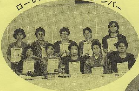
ローレルソサエティのメンバー

長月に 白く清く 芙蓉咲き せん細な美は 誠実をよぶ 一年間本当にありがとうございました。