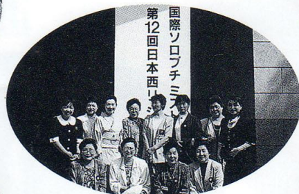
西リジョン大会 in 鳥取