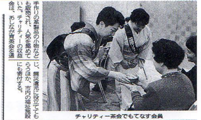
チャリティー茶会でもてなす会員