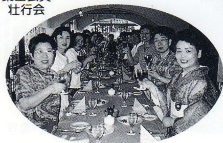
淡路方面 移動例会 カンパニー