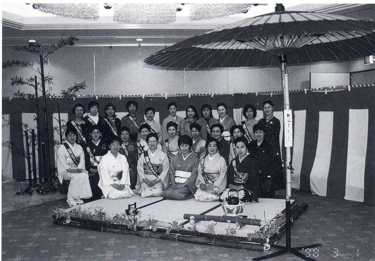
3月1日 リーガロイヤルホテル新居浜にて チャリティー茶会