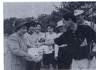
募金する参加者ら