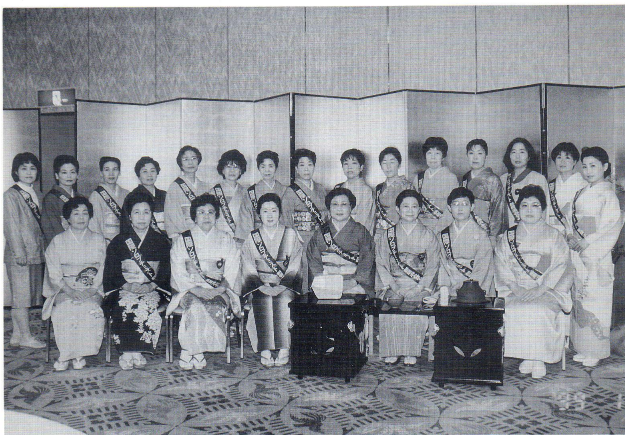
1月24日 リーガロイヤルホテル新居浜にて チャリティー茶会