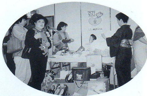
フリフリマーケット（ユアーズコープにて）