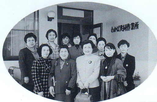
わかば共同作業所訪問

新居浜市の女性奉仕団体、国際ソプロチミスト新居浜みなみ何歳幹事会長、二十七人は二十四日、同市龍田町のリーガロイヤルホテル新居浜でチャリティー茶会を開いた。 和服姿の会員が抹茶と茶菓子で一人ずつおもてなしし、来場者は一匙に茶碗を奪り取り、香りや味をじっくりとたのびました。 会場には軽運の小原流、壁紙御流、刺心流の生け花作品約二十点の展示もあり一服した来場者が熱心に鑑賞、デザートのパザールも開かれ人気を集めていました。 チャリティーの収益金は、同市の福祉施設や高知県の水害義援金などに寄付するとして。 和服姿の会員が茶をふるまう「国際ソプロチミスト新居浜みなみ」のチャリティー茶会