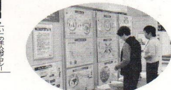
人身売買撲滅パネル展