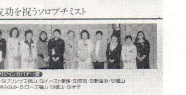
成功を祝うソロプチミスト