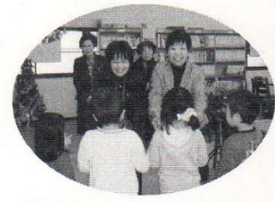
東新学園クリスマスプレゼント