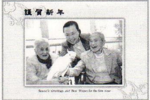
ナザレ園より年賀状

クラブ活動 SI新居浜みなみ フラダンスで輝ける韓国ナザレ園～競争で個性と なった女性たち～ ■2011年1月29日