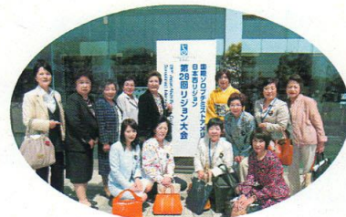
第28回日本西リジョン大会(松山)