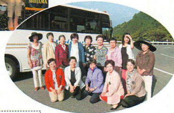
移動例会 in 別子山