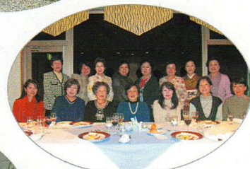
冬の花火(クリスマス会)