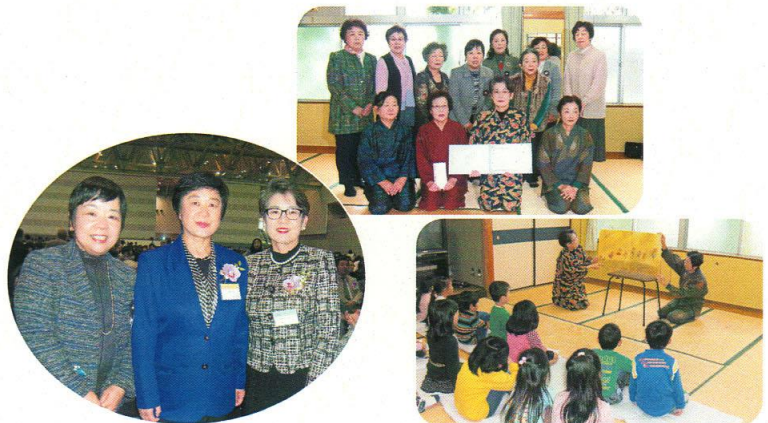
社会ボランティア賞贈呈式「民話の里・すみの」