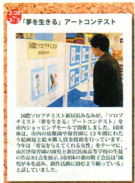
南沢津保育園・南高絵画展 図書贈呈(inイオンモール新居浜)