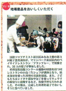
食育講座(十全保育園)