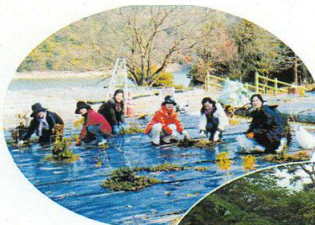
あじさい見守り活動