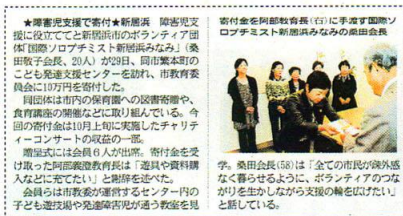
発達支援課へ寄付金贈呈式