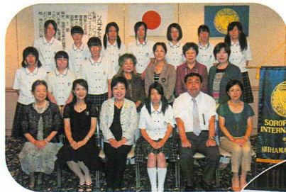
南高Sクラブ入会・交代式